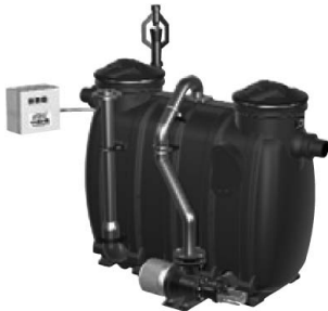
„E+S” Teljesen automata típus