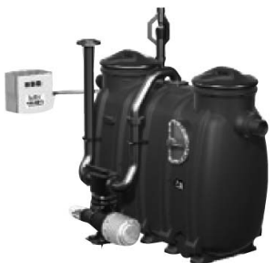
„E+S” Kézi típus