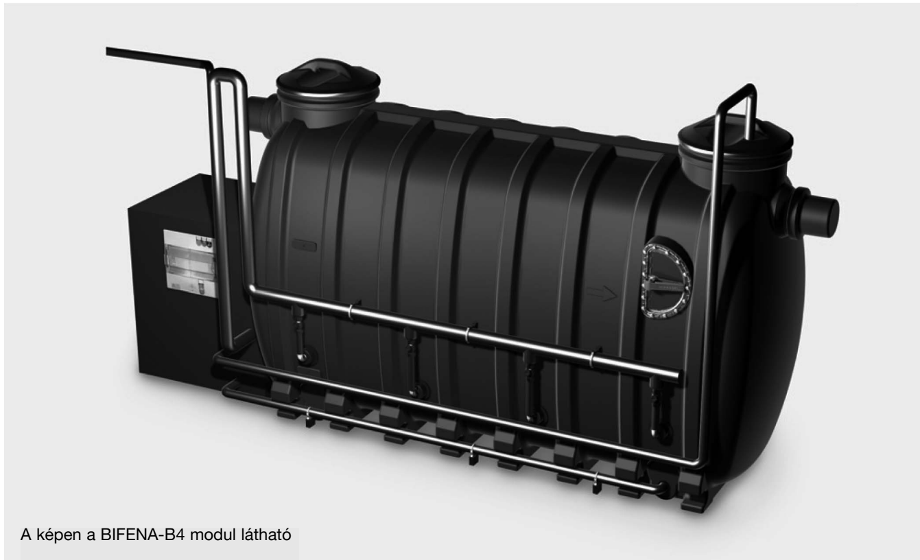
A képen a BIFENA-B4 modul látható